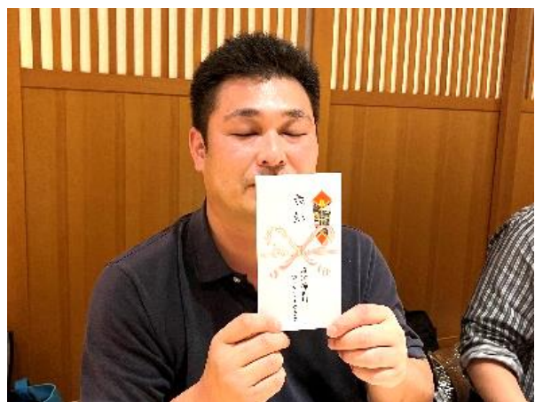
前年度 メークアップ出席率100%達成 川口会員