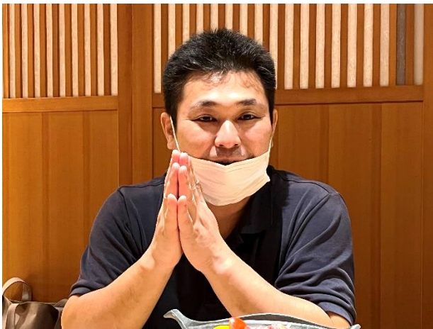
第1847回例会 会長挨拶