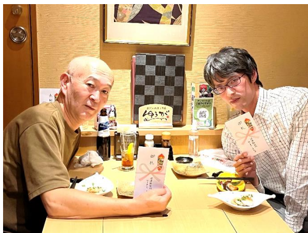
安本前会長・齋藤前幹事 お疲れ様でした！