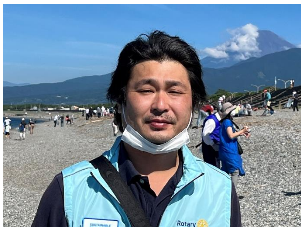
第1843回例会 会長挨拶