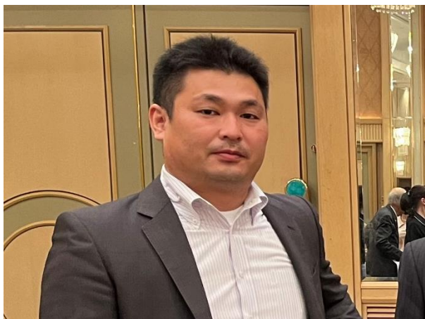
第1845回例会 会長挨拶