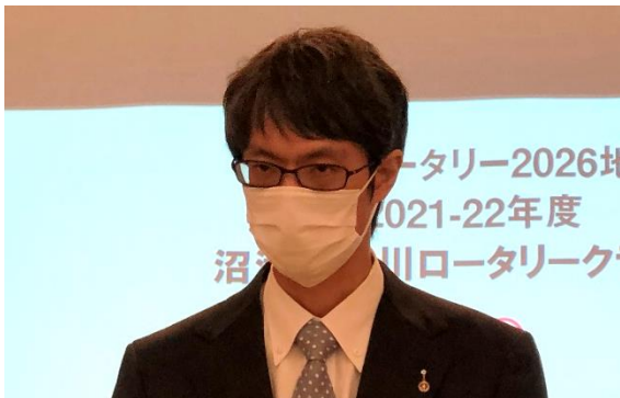
第1829回例会 会長挨拶