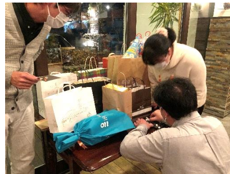
梅田会員の娘さんお手伝い