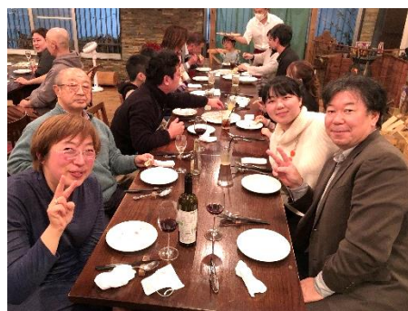
菊地会員&梅田ファミリー