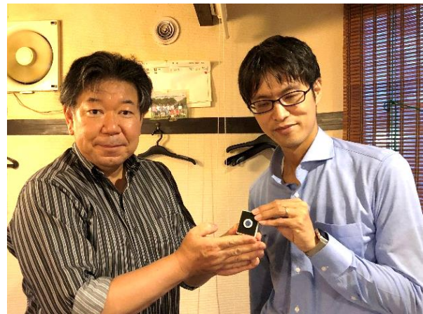
前年度修了した梅田会長から、安本次年度会長へ。