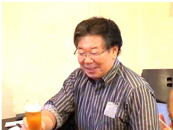
第1799回例会 会長挨拶