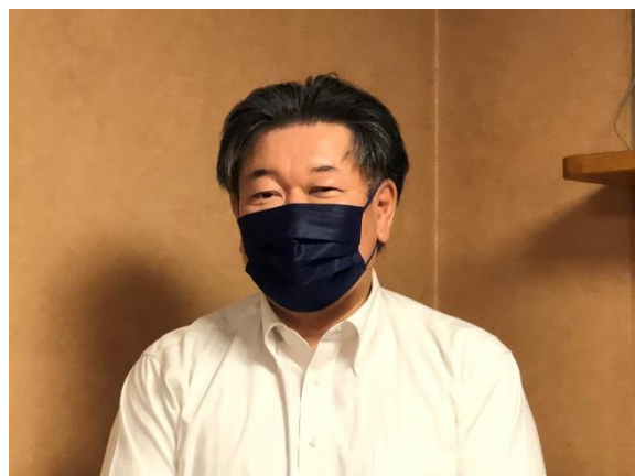
第1796回例会 会長挨拶