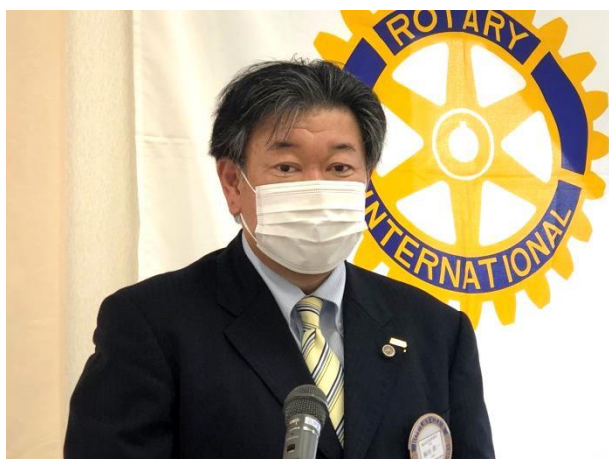
第1793回例会 会長挨拶