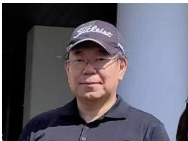
第1792回例会 会長挨拶