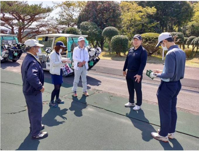
沼津国際カントリークラブにて10時スタート！ 例会の様子