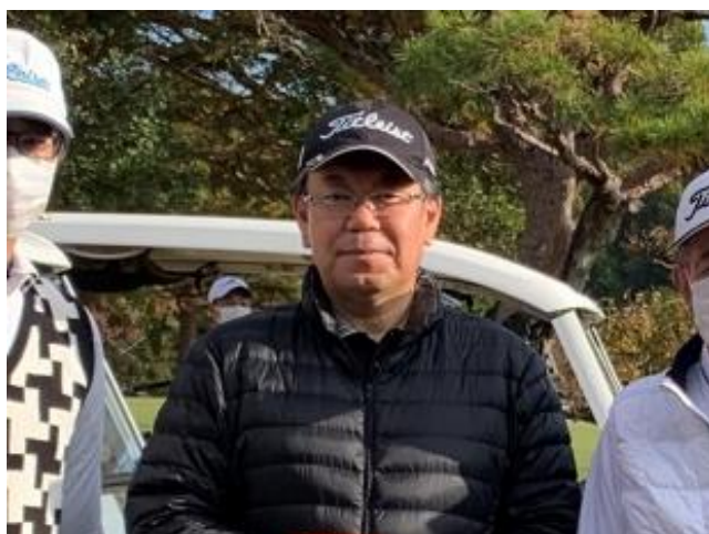
第1778回例会 会長挨拶