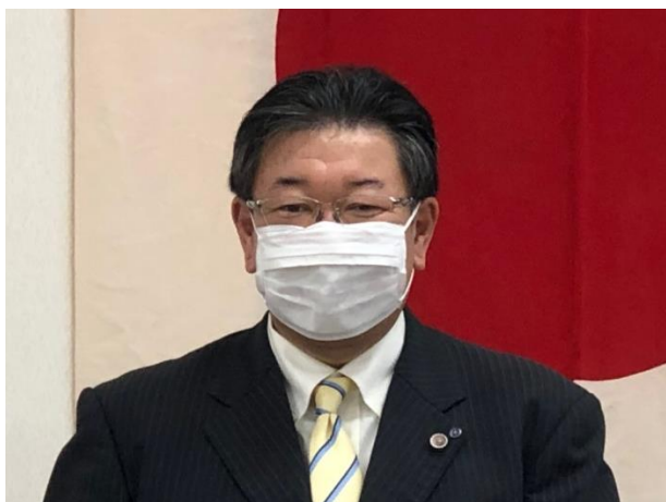
第1775回例会 会長挨拶