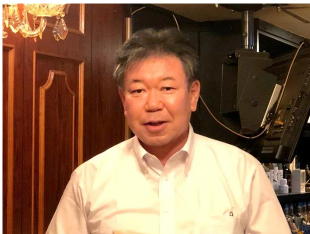
第1773回例会 会長挨拶