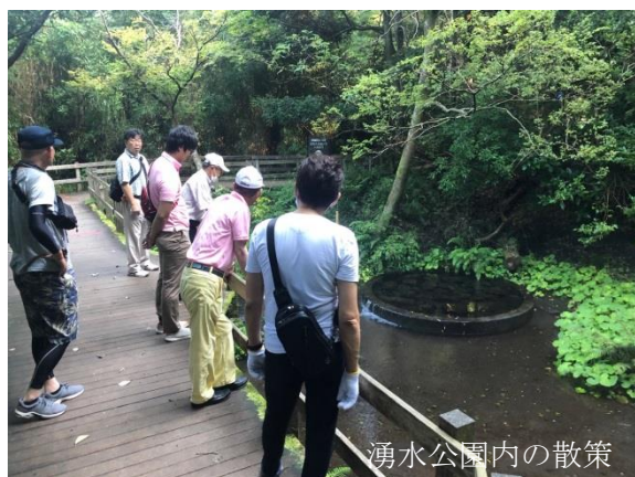
湧水公園内の散策