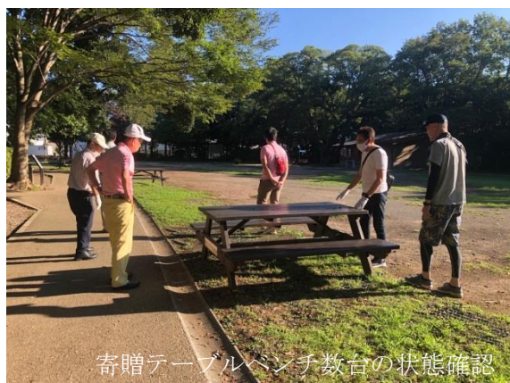
寄贈テーブルベンチ数台の状態確認