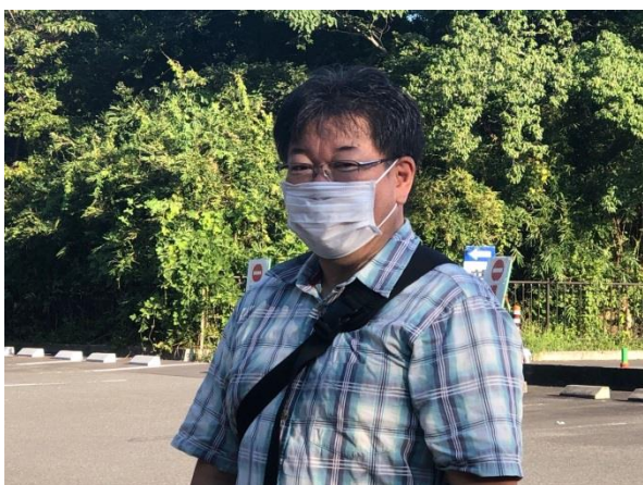
第1770回例会 会長挨拶