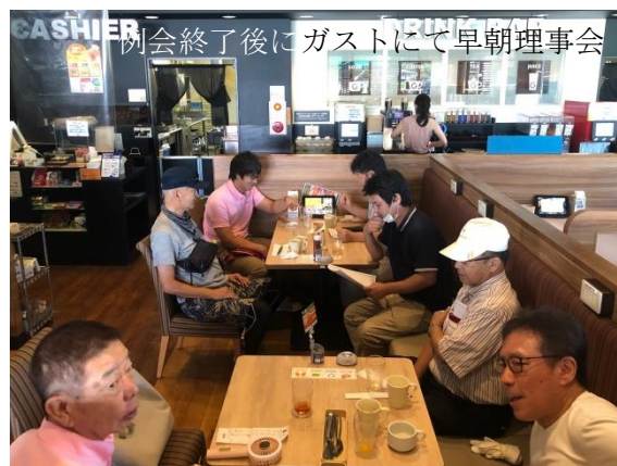
例会終了後にガストにて早朝理事会