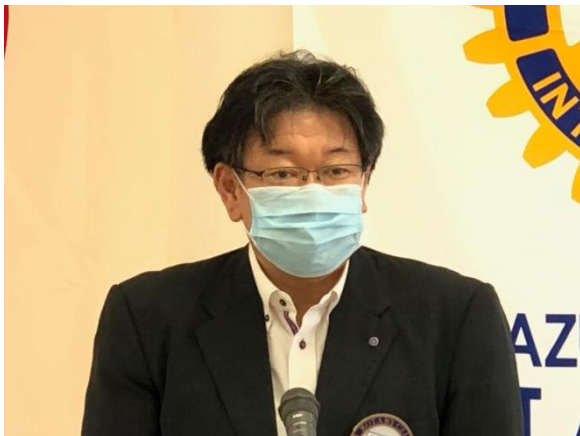
第1767回例会 会長挨拶