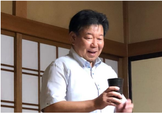
乾杯の挨拶は梅田会員