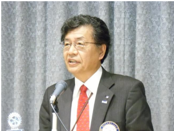
第1643回例会 会長挨拶