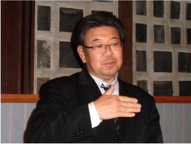
乾杯の音頭は梅田パスト会長