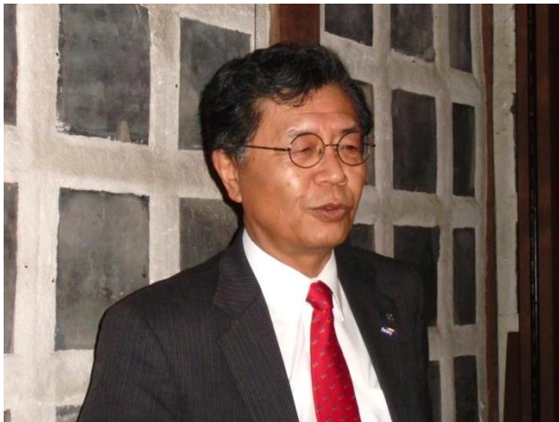
第1639回例会 会長挨拶