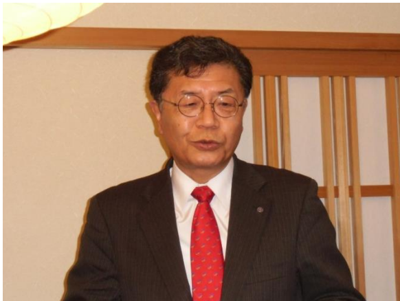
第1628回例会 会長挨拶