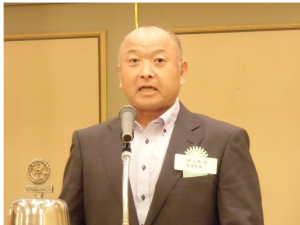
桐陽高等学校校長様よりご挨拶