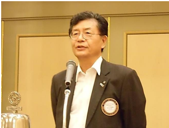
第1612回例会 会長挨拶