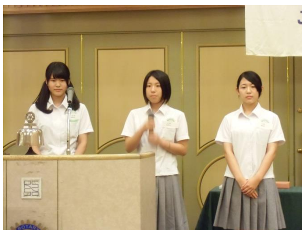
桐陽高等学校インターアクトクラブの生徒さんよりご挨拶