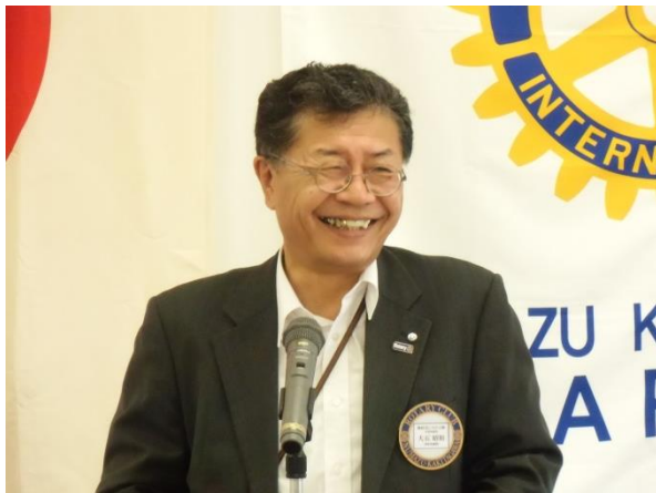
第1609回例会 会長挨拶