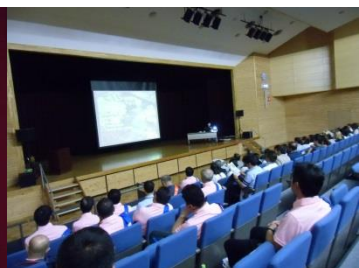
柿田川のレクチャー