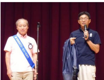
清水町へ胴付長靴を寄贈

本日は創立35周年記念事業の一つであります、米山奨学生の柿田川公園清掃体験の内合わせを行い、その後奨学生をお迎えして清掃手順の説明、作業を行いました。