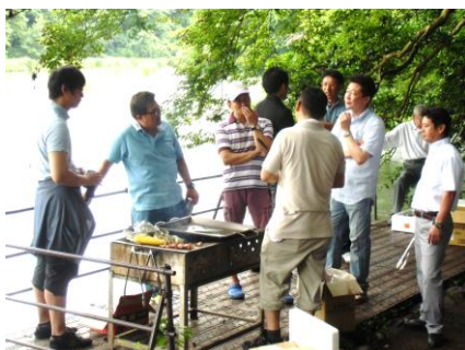
焼く量が多いので焼き場は大忙し