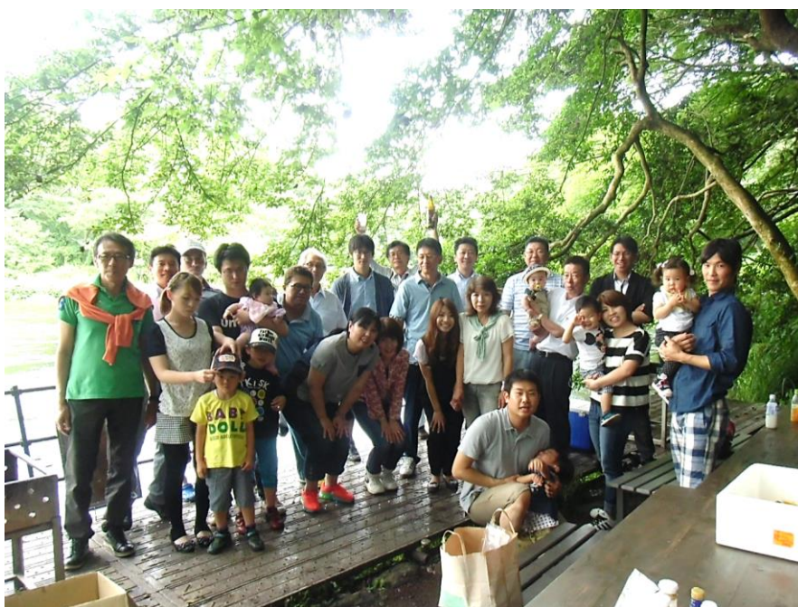
総勢31名の参加となりました！