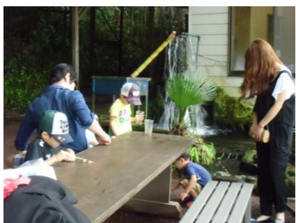
子供達はカニ捕りに夢中