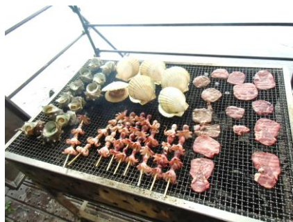
新鮮な魚介にジューシーなお肉！