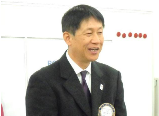
第1466回例会 会長挨拶