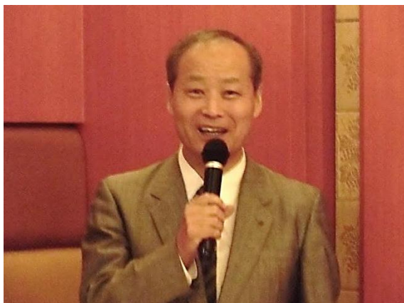
第1441回例会 会長挨拶