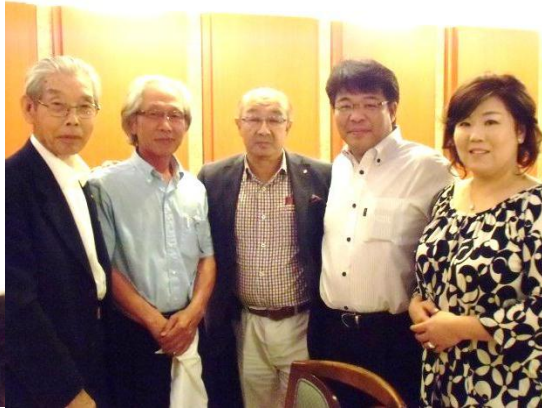
高田会員の奥様と一緒に