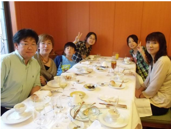
お子様同士も久々に再会