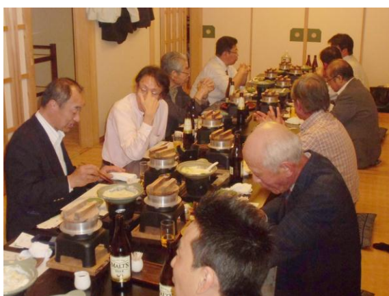
美味しいお料理を沢山頂きました。