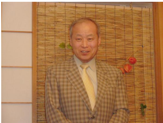
第1432回例会 会長挨拶