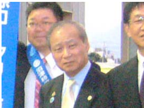
第1415回例会 会長挨拶