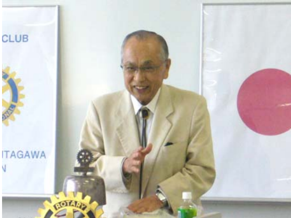
報徳思想と企業経営