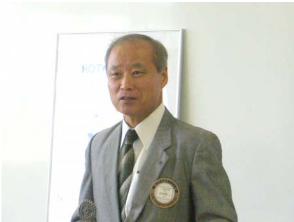
第1406回例会 会長挨拶